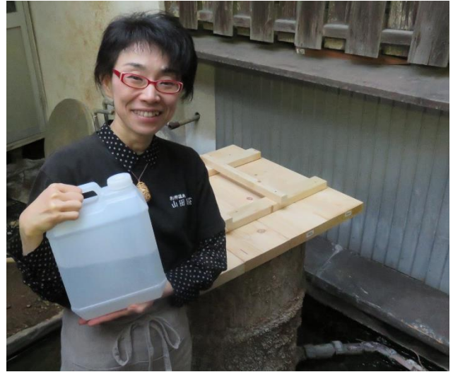
「別府やまだ泉」源泉と山田別荘女将