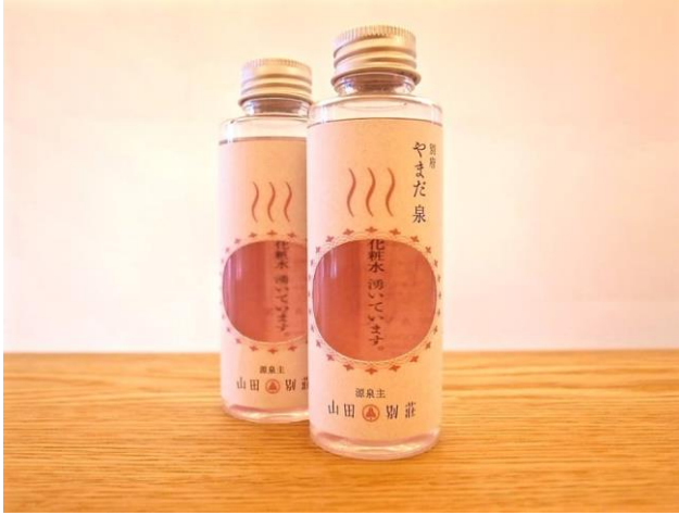
「別府やまだ泉」製品画像 100ml